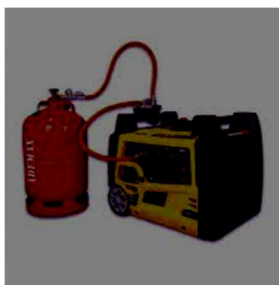
groupe électrogène 3 kwh jusqu'à 13 h d'autonomie bonbonne de gaz fournie sur demande en sus