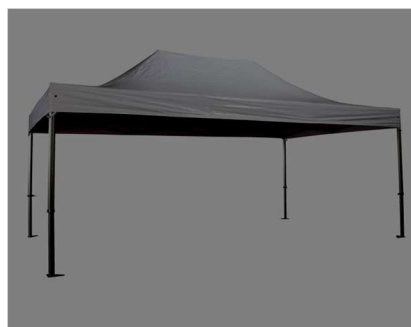
barnum de 24 m 2 avec parois et lests de 20 kg